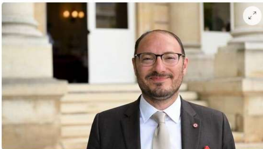
Denis Masségli, le député de la 5 e circonscription de Maine-et-Loire.

Denis Masségli, le député de la 5 e circonscription de Maine-et-Loire, fait entendre sa voix dans le débat qui entoure le projet immobilier porté par le groupe Nexity dans le quartier du Planty à Cholet. Pour rappel, ce projet, dont le permis de construire est toujours à l'instruction, porte sur 102 logements, répartis en quatre bâtiments à construire sur des terrains occupés notamment par l'ex-école du Planty et l'ancienne carrosserie Macquigneau. Depuis plusieurs mois, une cinquantaine de riverains se sont fédérés en collectif pour le contester arguant en particulier de l'enclavement du site.